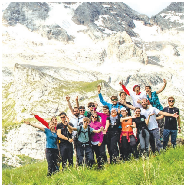
Gli organizzatori di Un posto in cui tornare

Quanto ha prodotto l'Ue sta dando frutti notevoli, e pure in questo periodo in cui si è più timidi non si è invertita la rotta. Ma paradossalmente anche uno dei Paesi più inquinanti nel passato, pensiamo alla Cina di 20 anni fa, sta facendo notevolissimi passi avanti rispetto al passato. Si tratta – conclude il filosofo - di avere il coraggio di fare queste scelte. E io mi auguro che chi vota ci pensi, guardando al futuro dei suoi figli e nipoti».